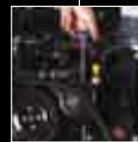
Enkel drenering av vannsystemet